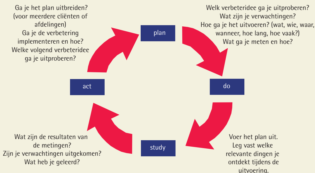
Fig. 1 Verbetercyclus (naar Deming, 2000)

Het verbetermodel houdt in dat elk doorbraakteam begint met het formuleren van een 'smart'-doelstelling. Deze heeft betrekking op een door de managers direct gevoeld organisatieprobleem. In het doorbraakproject 'Op (leeftijd) inzetbaar' hebben doorbraakteams gewerkt aan het verlagen van het ziekteverzuim, het verhogen van de mobiliteit van medewerkers en/of het verminderen van de werkdruk; doelen die bijdragen aan het inzetbaar houden van medewerkers.